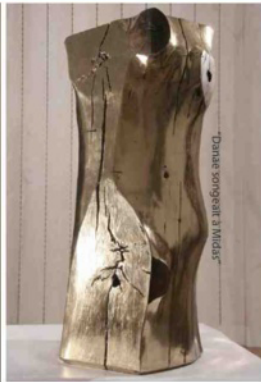
"Danse songeait à Miras"